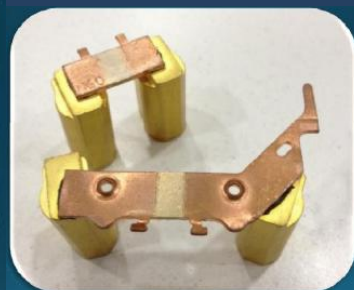
銅、ベリリウム、テリリウム銅、その他銅合金部品