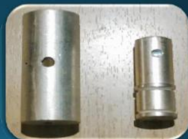
打抜き部品、部分加工品